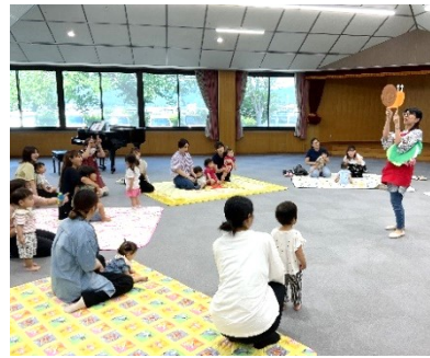
カタツムリの目が飛び出すよ！