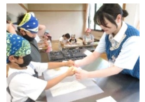
パン作りを一緒にしました。