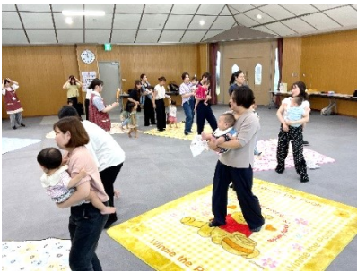
音楽に合わせて、動きます。