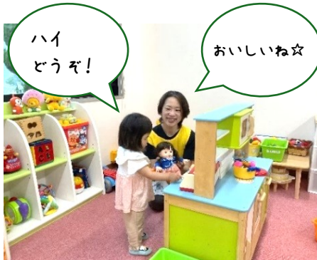
ファミサポルームで預かりの様子