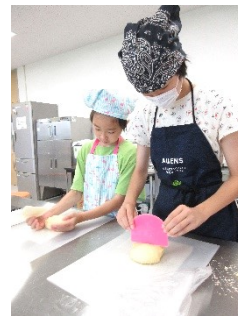
姉妹で参加しました。