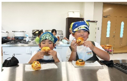
大変よくできました🍞