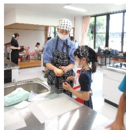
どんなカタチにしようかな…楽しみです☆