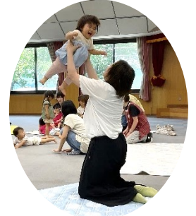
子どもの成長を感じました！