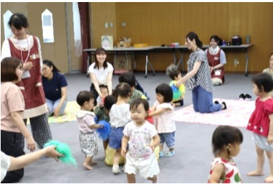
お片付け♪お片付け♪