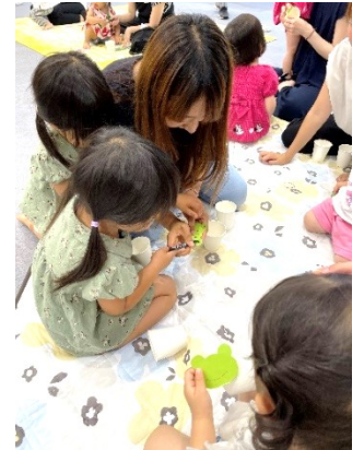
『ぴよんぴよんカエル』 作ったよ☆