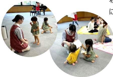
絵本の読み聞かせなどに挑戦しました。