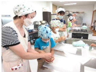
自分の好きな具材を入れて、型もこだわりました。