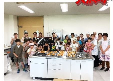
パンのいい香りにみんな笑顔いっぱいでした(^^) /

子どもと一緒にできて、楽しかったです。パン作りのポイントも教えてもらえて、お家でもチャレンジしてみたいと思います。(ママ) たのしかった！！(子ども)