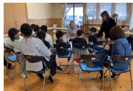
ボランティアさんによる絵本の読み聞かせ