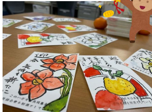
ステキな年賀状が届きました

ご協力いただいた「めだかの会」の皆さんに心より感謝申し上げます。(この事業は赤い羽根共同募金を活用しています。)