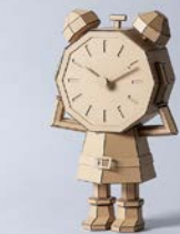
受賞作品 「ときのおもみ」

【高校生アートコンペティション 2025 特別賞を受賞】 手に持たれているのが表彰状、左下に受賞作品を掲載。