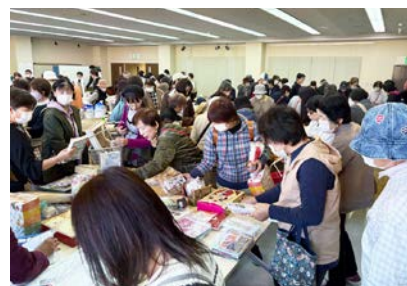
氷上地域での福祉バザー