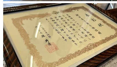
会場の様子(上)と丹波市からの表彰状(下)