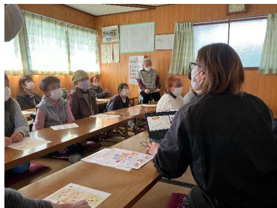
真剣にお話を聞かれる皆さん