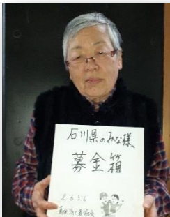
青垣消費者協会様

佐治えびす祭り実行委員会様、まねき食堂様 芦田自治振興会様、芦田青少年健全育成協議会様 江古花園運営委員会様、青垣消費者協会様