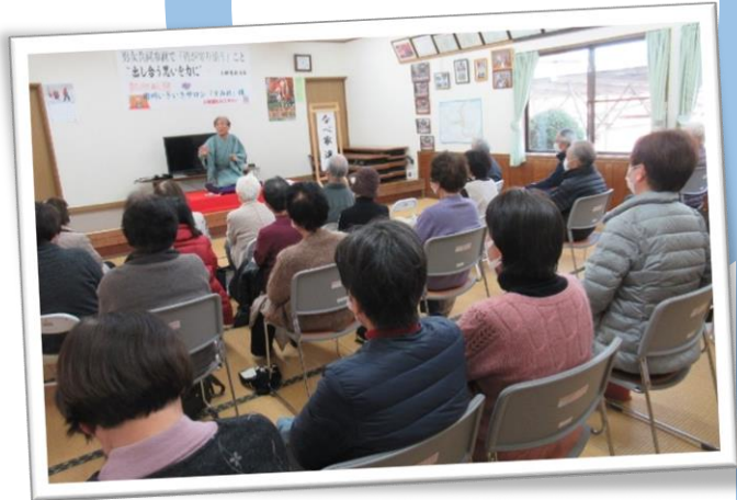
落語で寒さも吹き飛ばす大笑い!!!

いつもと違う方たちと久しぶりの再会もあったようで笑顔あふれる素敵な催しとなりました。