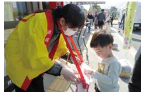
道の駅丹波おばあちゃんの里にて