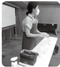
カボチャのおやき ジャガイモチヂミ