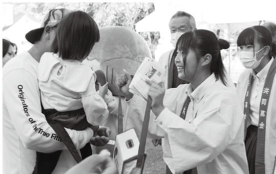
街頭募金の様子（丹波 GO！GO！フェスタ）

また、啓発活動として、中高生や募金協力員等にご協力いただき、市内の商業施設やイベントで街頭募金を行っています。