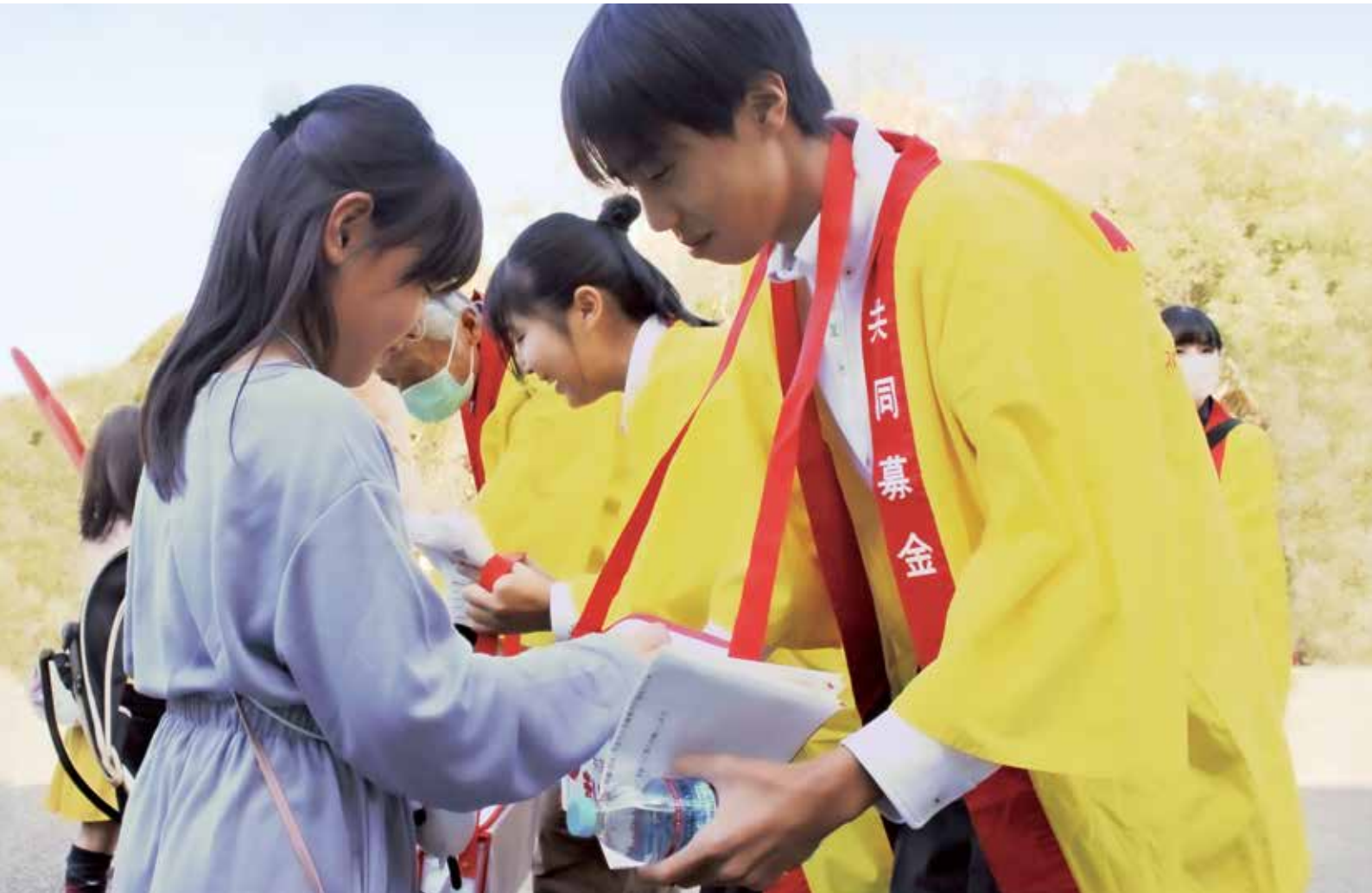
丹波 GO! GO! フェスタにて