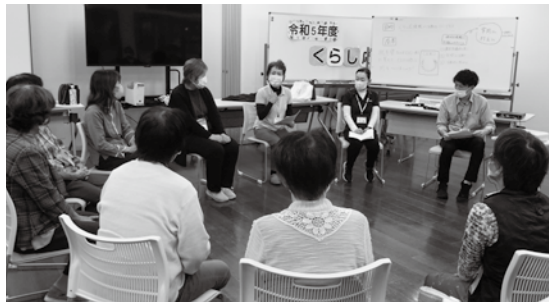
活動中のくらし応援隊と交流の様子

9月29日・10月12日に、掃除やごみ出し等の生活支援を行う有償ボランティア「くらし応援隊」の養成講座を行いました。福祉講演会やコミュニケーション講座を実施し、また、認知症について学んでいただきました。最後は、現在活動中のくらし応援隊と交流がありました。2日間で延べ26名の参加があり、現在のところ7名の方がくらし応援隊として登録していただきました。参加者からは、「和やかな雰囲気の中で楽しく講座を聞くことができました」「知らないことも知れて、勉強になった」等の感想がありました。今後ますます地域の中でくらし応援隊の活動は必要になる中、くらし応援隊の養成や活動のサポートをしていきます。