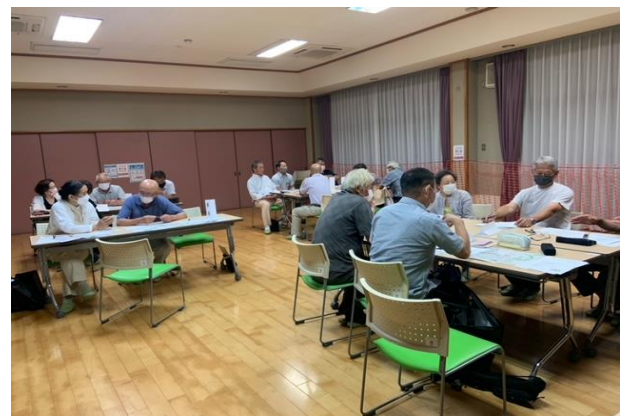
7月26日話し合いの様子

7月26日春日部荘にて自治協議会会長さん、自治会長さん、民生児童委員さん、福祉委員さん、コミュニティ活動推進員さんにお集まりいただき、各自治会ごとに分かれて自分の地域の良いところや課題などについて話し合いました。地区の皆さんにとって誰もが住みよい春日部地区となるよう、今後も定期的に開催していきたいと思っています。