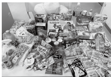
生活にお困りの方へ