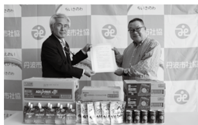
NPO 法人 e ワーク愛媛 様