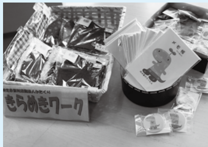
布マスク、メモ帳、缶バッジ