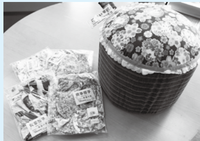
炊事ぼうし、正座いす