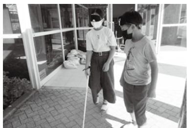
福祉学習の助成金へ