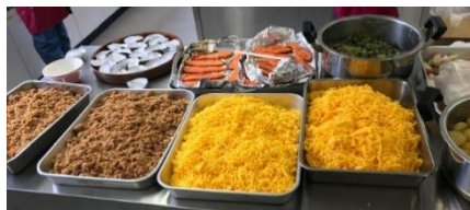
とりそぼろと錦糸卵、たくさんできました