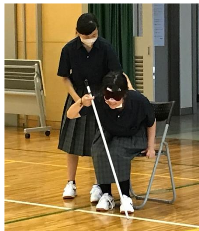
手を添えて一緒に椅子を触って、座る場所を確認します。