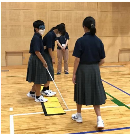
青垣中学校の体育館の渡り廊下にも点字ブロックがありました。