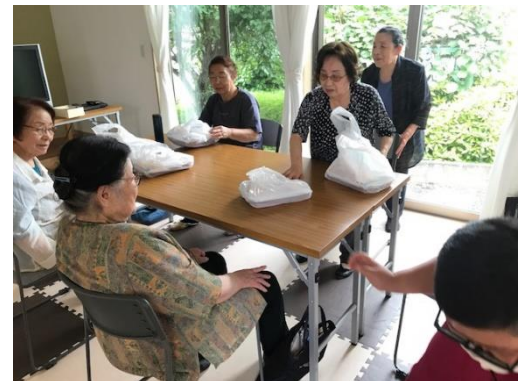
いき百の仲間で、公民館で一緒に食べます。