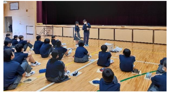
白杖の使い方と介助の方法を学びます

短縮言葉の多い現在ですが、物事を正確に表現して伝えることの難しさも体験できたのではないのでしょうか。