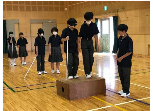
大きな段差。しっかり声をかけて、慎重に！