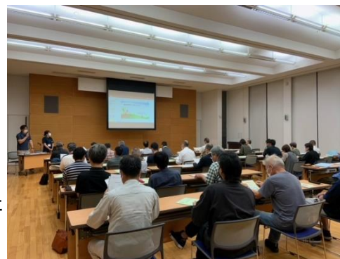
第1回春日地域 福祉委員会 (R5.6.13)