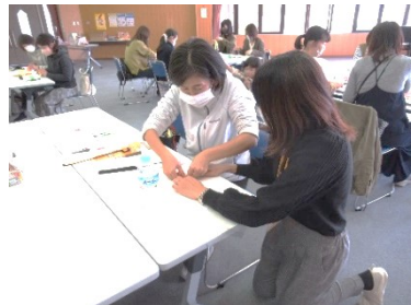
丁寧に教えていただきました