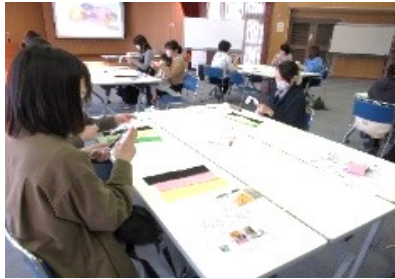
久しぶりの手作業です。