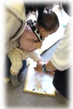
上手にできたかな…