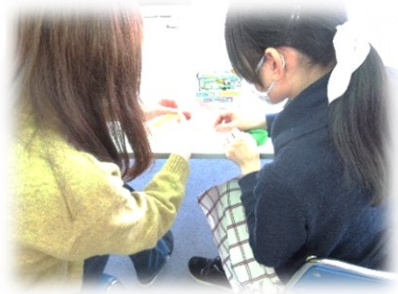
お隣同士で教えあったりしながら制作しました。

いろいろな形に変わり、遊びが展開していきます。柔軟な遊び方が、知育に結びついていきます。