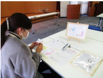
子どもの成長を願い、思いを込めて… 元気におおきくなってね☆