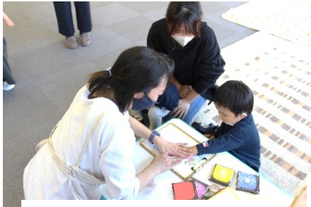
お兄ちゃん、上手です☆