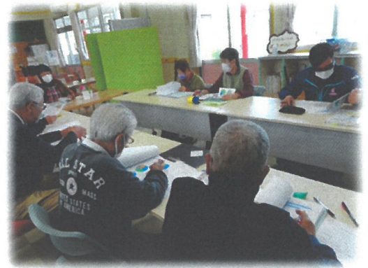
支えあい推進会議の様子