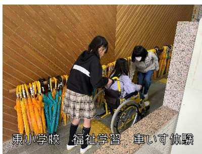
東小学校 福祉学習 車いす体験

ご協力いただいた会費は、児童・生徒が車いすや高齢者疑似体験等を通して学ぶ『福祉学習』や、主に高齢の方々が自治会内の公民館等で茶話会や、レクリエーションを楽しみ見守りや集いの場になっている『ふれあい・いきいきサロン』の活動助成、ボランティア活動などの取り組みをされているボランティアグループへの助成など様々な取り組みへの支援に活用させていただきます。みなさまのご協力をよろしくお願いいたします。