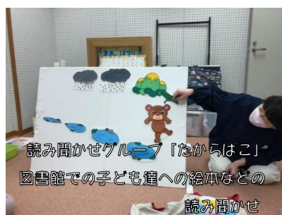
読み聞かせグループ「たからはこ」 図書館での子ども達への絵本などの 読み聞かせ