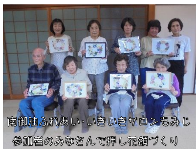
南御油ふれあい・いきいきサロンもみじ 参加者のみなさんと押し花額づくり