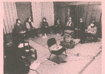
2月の東町自治会福祉教室の様子