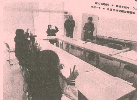
自分の名前やあいさつを学びました

楽しく学んでみよう。手話ミニ講座 おしよりの聴覚障害者 にちし:令和5年4月25日(火)16時～17時ごろ ばしよ:丹波市社会福祉協議会青垣支所 申込: (締切4月21日)