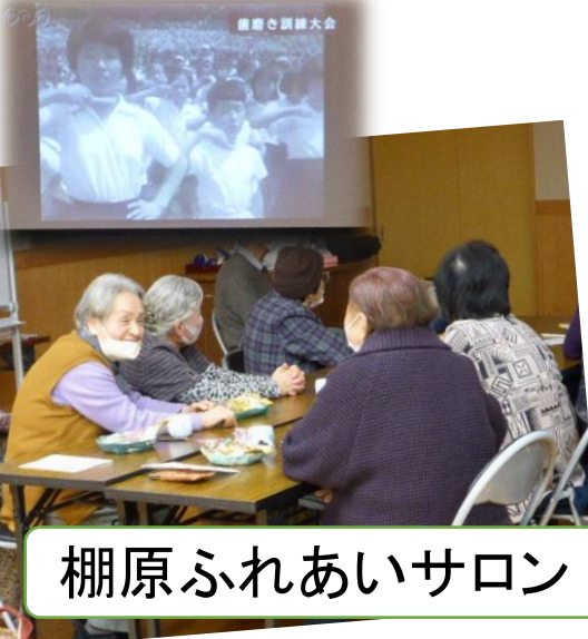
棚原ふれあいサロン

棚原ふれあいサロンに取材に行くと昔の生活の様子を見ながらお話をされていました。「昔はこうして洗濯してたね」「今の人は出来へんわ」と話をされていました。懐かしい思い出を語り合うことで認知症予防になるそうです。体操や脳トレもいいですが、思い出話に花を咲かせるのも良いことだと思いました。