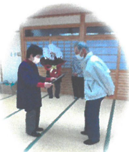
突然の感謝を伝えられ、 驚きで言葉が出ず... (写真右が前任者)

上垣ふれあいの会は、毎年1月頃にサロン参加の皆勤賞表彰や、 ゲーム大会などで楽しめます。