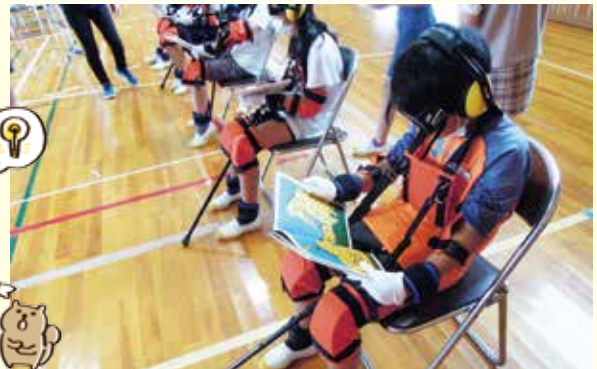
福祉学習の材料や講師料に