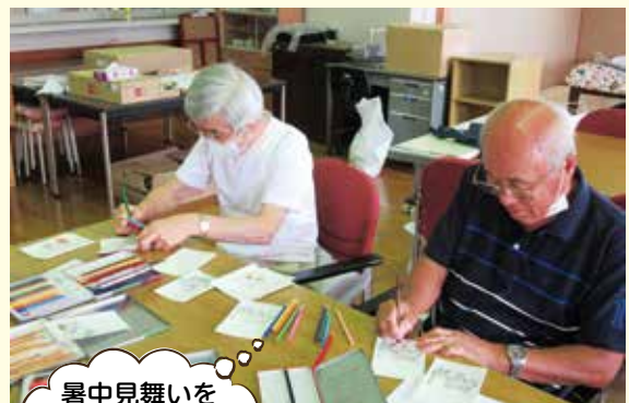
暑中見舞いを書いています