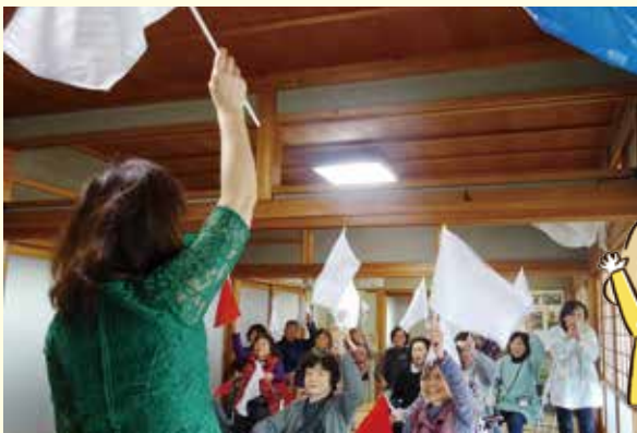
ふれあいきいきサロンの 運営支援（助成金）に