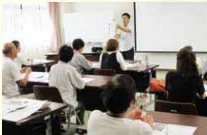
ボランティア入門講座