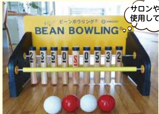
サロンや地域で使用してください!