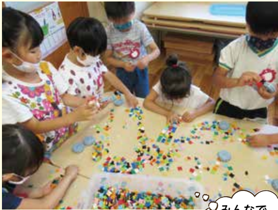
みんなで ブロック遊び