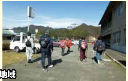
ノルディックウォーキング (地域見守り) 【生きがいきづくり講座】