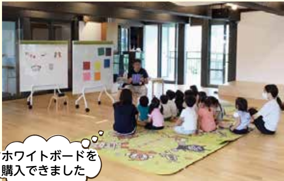
ホワイトボードを 購入できました