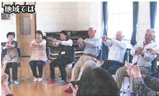
ふれあいいいききサロンの運営支援