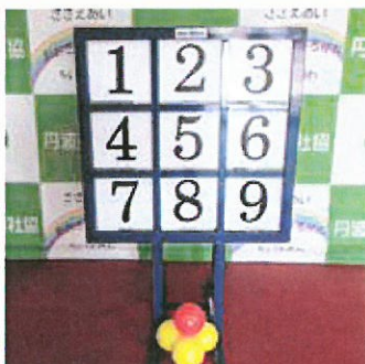
貸し出し用のレクリエーション用具整備