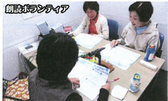
ボランティアグループ活動助成