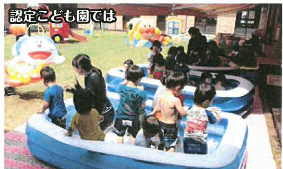
絵本、遊具、プール、靴箱などに