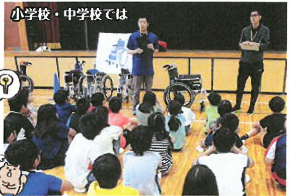
小学校・中学校では