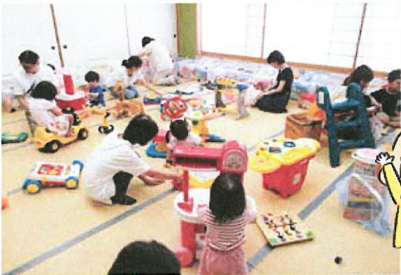
おもちゃライブラリー活動助成に