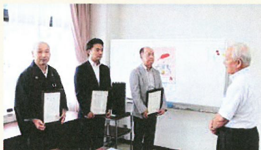
左から、宗教法人也足寺様、株式会社清水保険事務所様、三井化学エムシー株式会社柏原工場様、長井会長