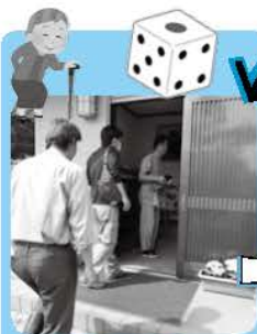
迎えた当日、 参加者が続々と!