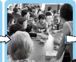
緊張もなくなり、 大盛り上がり