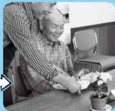
参加者からも 「良いね～」と この笑顔