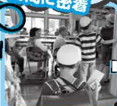
ドキドキして 到着

上久下小では、毎年6月に全校で各ふれあいサロンへ訪問されています。山南地域ではこの1校の実施で、交流は15年以上前から続いています。お互いが楽しみにされ、大切に受け継がれています。