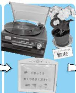
くつろげる場への 思いがあちこちに!