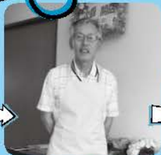
一番心配されていた 自治会長さんも ひと安心