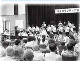
▲氷上中学校 吹奏楽部