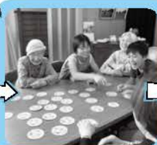
みんなで遊べる ゲームを考えました