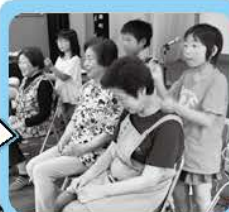
最後は肩たたきの プレゼント