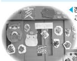
認定こども園ふたば 園児似顔絵