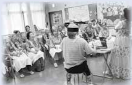
職員のお芝居にワハハと大笑い(^-^)