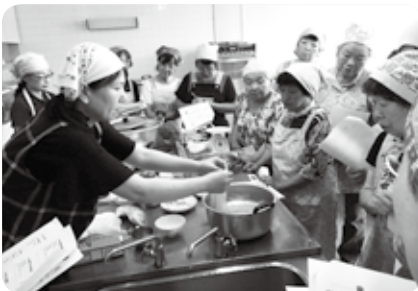
トマッピーさんの実演

いつ発生するか分からない災害に備え、身近な生活から取り組んでもらえるような教室を今後も行っていきたいと思います。