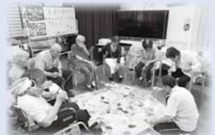
「魚釣りゲーム」盛り上がります！