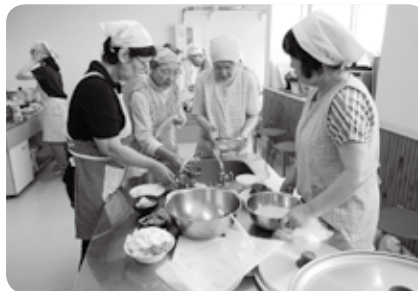
班ごとに実習スタート！