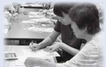
ボランティアさんと一緒にカレンダー作り