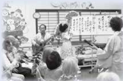
フラダンスとギターで気分はハワイアン♪