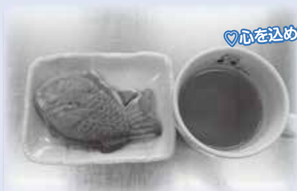
おやつは手作りです