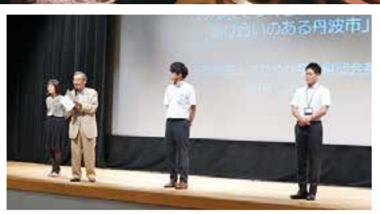
3名の地域支えあい推進員