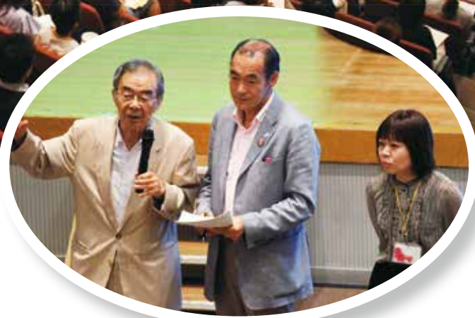
市長と地域支えあい推進員も登壇！ 講演に参加！